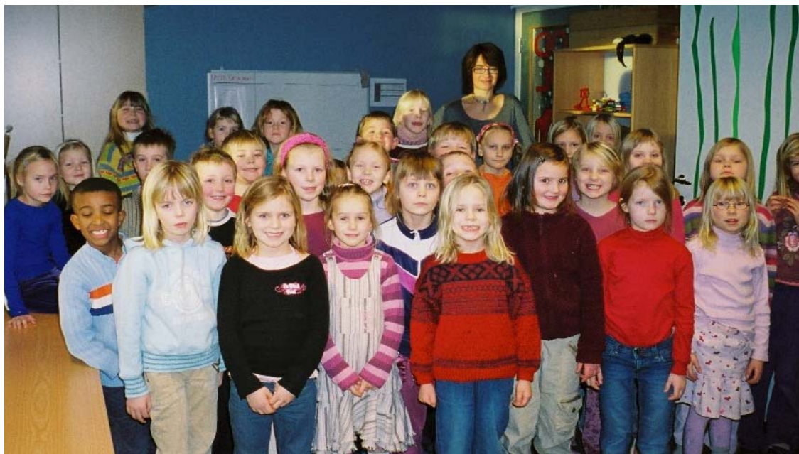
Stolte Grønt Flagg-elever ved Hallset skole i Trondheim.

Grønt Flagg sentralt har utarbeidet en god del informasjonsmateriell som kan benyttes. Når det gjelder øvrig informasjon, vil e-post, telefon og bruk av nettsider være de viktigste kanalene.