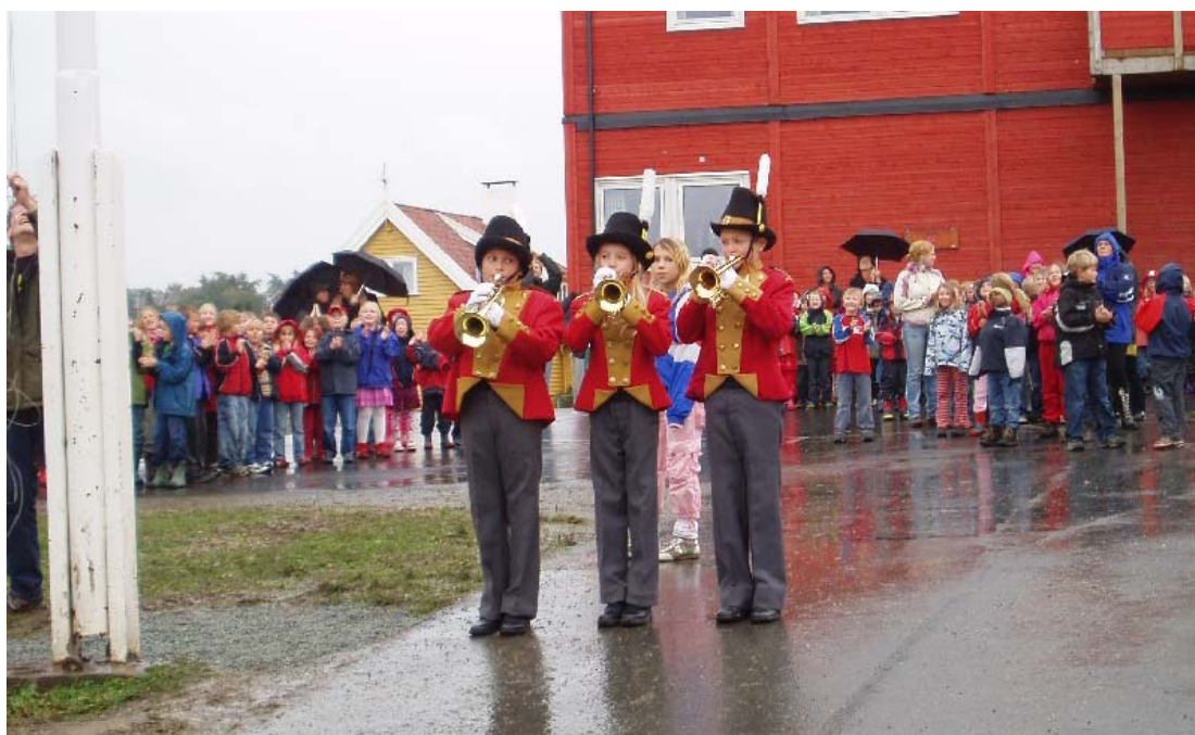
Det var stil over flaggheisinga (helt til venstre) utenfor Åsveien skole i Trondheim.