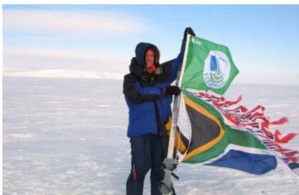
Det grønne flagget på Nordpolen!