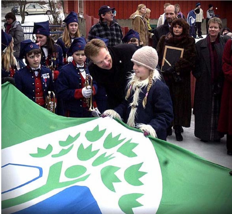
Byåsen skole i Trondheim får utdelt det grønne flagget som bevis på at de er miljøsertifiserte. Daværende miljøvernminister Børge Brende gratulerer en av elevene.